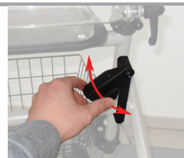
B. Riegel justieren