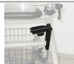
C. Riegel offen