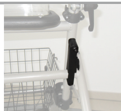
A. Riegel gesichert

Abbildungen des Sicherungsriegel für die Punkte 3.8 und 3.9.